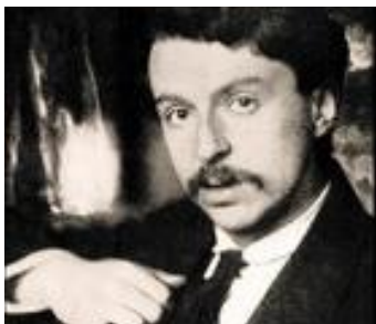
Народный Комиссар юстиции И.З.Штейнберг

4 января 1918 года Народным Комиссариатом юстиции и Народным Комиссариатом по местному самоуправлению для проведения в жизнь декрета